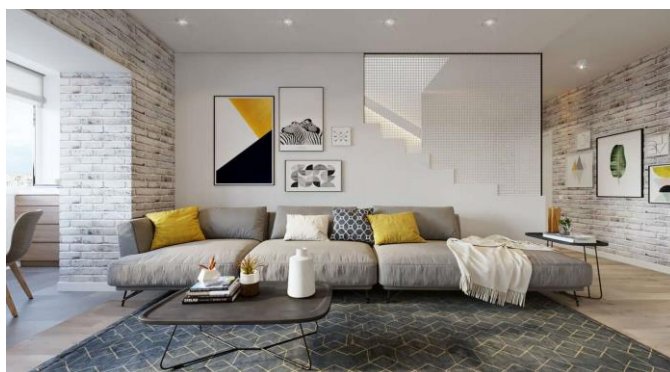
Стиль лофт. Свободное пространство, открытые балки, трубы коммуникаций, участки оголенных стен