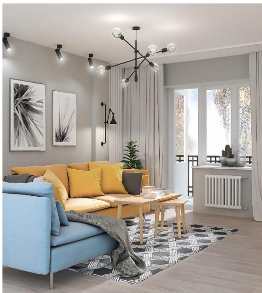
Скандинавский стиль. Простота, минимализм и воздушность

Совет №2. Достойным стилевым решением станет скандинавский стиль или стиль лофт – просто, бюджетно и со вкусом. Если попытаться имитировать люкс, то можно попасть впросак – затраты огромные, а смотрится ужасно.